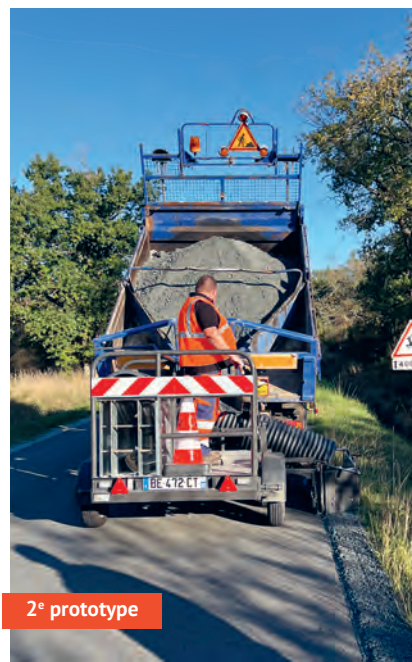
2 e prototype

Mézières : « C'est un gain de temps : ce que l'on faisait manuellement en 4 jours en présence de cinq agents, on le fait désormais en une journée avec 3 agents et de manière automatisée. Cela représente également des économies puisque nous utilisons moins de matériaux. En termes de pénibilité, le travail est moins éprouvant physiquement. Et le résultat plus précis, plus esthétique. Un deuxième prototype a été réalisé par un carrossier local, plus abouti. Il est actuellement en phase de test sur nos routes départementales, ce qui nous permet d'ajuster au mieux la machine ». Avant peut-être un déploiement à plus grande échelle ?